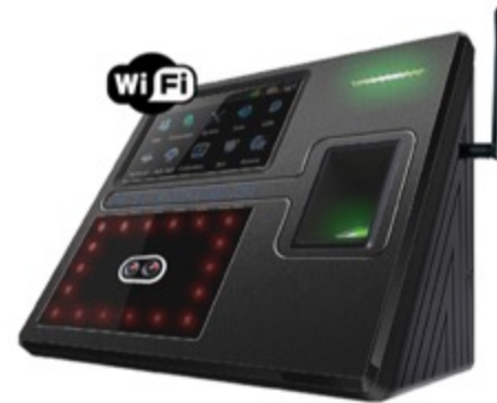
Bioface: Captura de rostro de cada empleado en el dispositivo para validar sus ingresos y salidas por reconocimiento facial