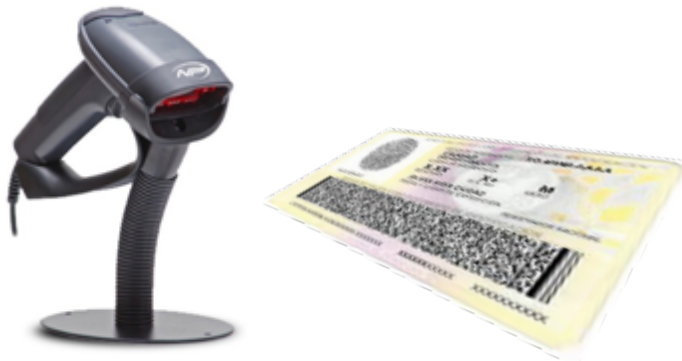
Lector de código de barras de la cédula